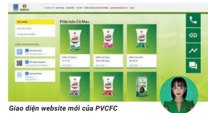
Giao diện website mới của PVCFC

Một trong những đổi mới mà PVCFC thực hiện trong năm 2021 đó là nâng cấp và thiết kế lại giao diện Website www.pvcfc.com.vn trên nền tảng công nghệ bảo mật mới nhất. Với công nghệ hiển thị đa nền tảng, tốc độ truy cập nhanh, giao diện thân thiện tập trung hiển thị số liệu cho nhà đầu tư, và cấu trúc các chuyên mục được sắp xếp phù hợp, thông minh,... Website đã cung cấp đầy đủ, kịp thời những thông tin quan trọng về đầu tư, cổ phiếu cho cổ đông/ nhà đầu tư, đồng thời giúp bà con nắm bắt nhanh những thông tin vụ mùa, thị trường và lĩnh vực nông nghiệp.