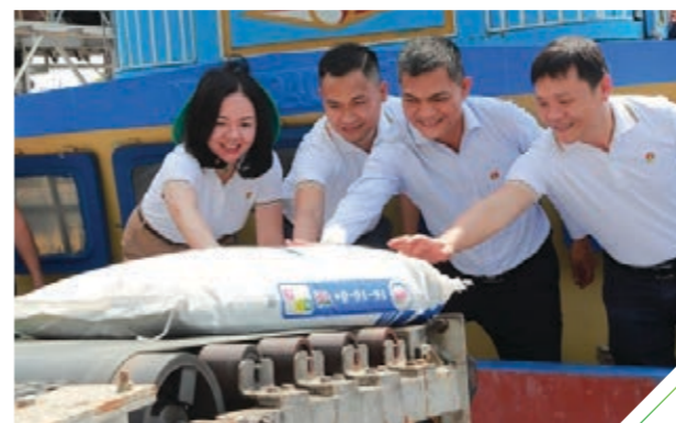
Lãnh đạo PVCFC trong buổi lễ chính thức ra mắt sản phẩm NPK Cà Mau

Vào tháng 4/2021, gần 20.000 tấn NPK Cà Mau đầu tiên đã xuất xưởng, góp phần đáp ứng nhu cầu đang tăng cao từ khu vực ĐBSCL trong vụ Hè Thu. Vượt xa ý nghĩa của việc đạt mục tiêu lợi nhuận, những lô hàng này đã làm phong phú hơn lựa chọn, gia tăng lợi ích và mang lại giá trị bền lâu cho bà con cũng như nền nông nghiệp nước nhà.