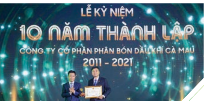
Buổi lễ kỷ niệm 10 năm thành lập PVCFC

Ngày 16/3/2021, PVCFC tổ chức thành công lễ kỷ niệm 10 năm thành lập (09/3/2011 – 09/3/2021) và 10 năm hoàn thành thành Cụm Khí – Điện – Đạm Cà Mau (2011 – 2021). Đây là một sự kiện vô cùng ý nghĩa đối với các thế hệ lãnh đạo và CBNV PVCFC để cùng nhau nhìn lại những mốc son đáng tự hào của chặng đường đã qua và hướng tới những thành tựu mới trong tương lai với tâm thế tự tin, sẵn sàng và quyết tâm.