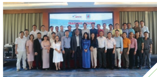
Các lãnh đạo PVCFC tham gia chương trình đào tạo Thông lệ quản trị tốt nhất năm 2021.

Để đứng vững và dẫn dắt doanh nghiệp đạt được những thành tựu bền vững trong bối cảnh nền kinh tế có nhiều biến động, PVCFC đã tăng cường nâng cao năng lực của HĐQT theo những Thông lệ quốc tế tốt nhất. Theo đó, PVCFC, với sự tư vấn của VietStar Training & Consulting JSC, đã tổ chức thành công khóa đào tạo về công tác quản trị điều hành tại PVCFC bằng hình thức offline và thảo luận qua Zoom. Thông qua 3 buổi chia sẻ về: Hiệu quả hoạt động của HĐQT, Kiến tạo giá trị và Quản trị doanh nghiệp, các chuyên gia, nhà điều hành cấp cao đến từ Singapore đã giúp Ban lãnh đạo PVCFC tiệm cận hơn với nhiều thông lệ quản trị công ty tốt nhất được quốc tế thừa nhận, sẵn sàng nâng cao, cải tiến chất lượng quản trị, giúp PVCFC ngày càng phát triển, thịnh vượng và không ngừng vươn xa.