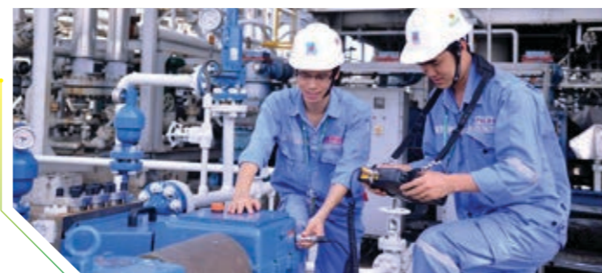
Đội ngũ kỹ sư của PVCFC hoàn thành bảo dưỡng tổng thể nhà máy trước kế hoạch đặt ra mà không huy động chuyên gia nước ngoài

Đợt bảo dưỡng tổng thể Nhà máy Đạm Cà Mau lần thứ 9 diễn ra trong bối cảnh nhu cầu thị trường tăng cao và đại dịch Covid-19 đang ảnh hưởng nặng nề đến các tỉnh ĐBSCL. Nhờ khả năng chủ động lập kế hoạch và đội ngũ có kinh nghiệm, vững tay nghề và tinh thần quyết tâm cao, ngày 22/11/2021 công tác BDTT Nhà máy hoàn thành sớm hơn so với kế hoạch đã đặt ra. Toàn bộ 1.729 hạng mục lớn nhỏ đều hoàn tất vượt trội mà không phải thuê đội ngũ chuyên gia hỗ trợ. Năng lực làm chủ công nghệ và sáng tạo tiên phong của PVCFC đã giúp những lô sản phẩm thương mại chất lượng cao được xuất xưởng kịp thời phục vụ bà con trong cao điểm vụ Đông - Xuân.