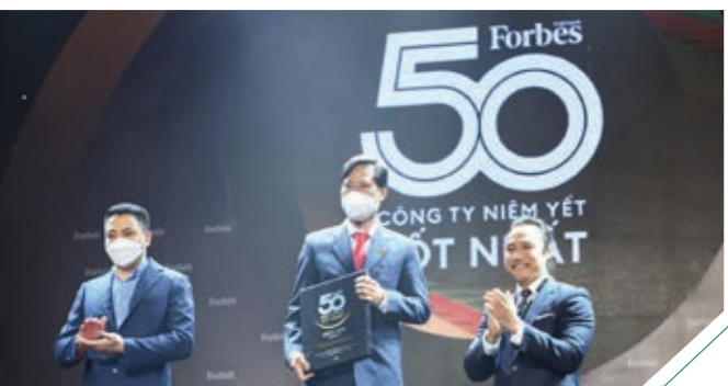
Giải thưởng "Doanh nghiệp niêm yết tốt nhất Việt Nam năm 2021" đã ghi nhận thành tích của PVCFC

Với tiềm lực nổi trội, bản lĩnh đương đầu cùng khả năng ứng phó trước những thách thức và khó khăn của đại dịch Covid-19, PVCFC đã được ghi tên vào danh sách "50 doanh nghiệp niêm yết tốt nhất 2021" do Forbes Việt Nam bình chọn. Để được vinh danh tại sự kiện uy tín lần này, PVCFC phải đáp ứng được các tiêu chí khắt khe của Forbes áp dụng toàn cầu và phù hợp đặc thù Việt Nam. Đây là lần đầu tiên PVCFC vươn lên vị trí Top 50 doanh nghiệp niêm yết tốt nhất Việt Nam. Với danh hiệu này, PVCFC ngày càng khẳng định vị thế và uy tín của một trong những Công ty đầu ngành, góp phần nâng thương hiệu Phân Bón Cà Mau - Hạt Ngọc Mùa Vàng lên một tầm cao mới trên thị trường trong nước và quốc tế.