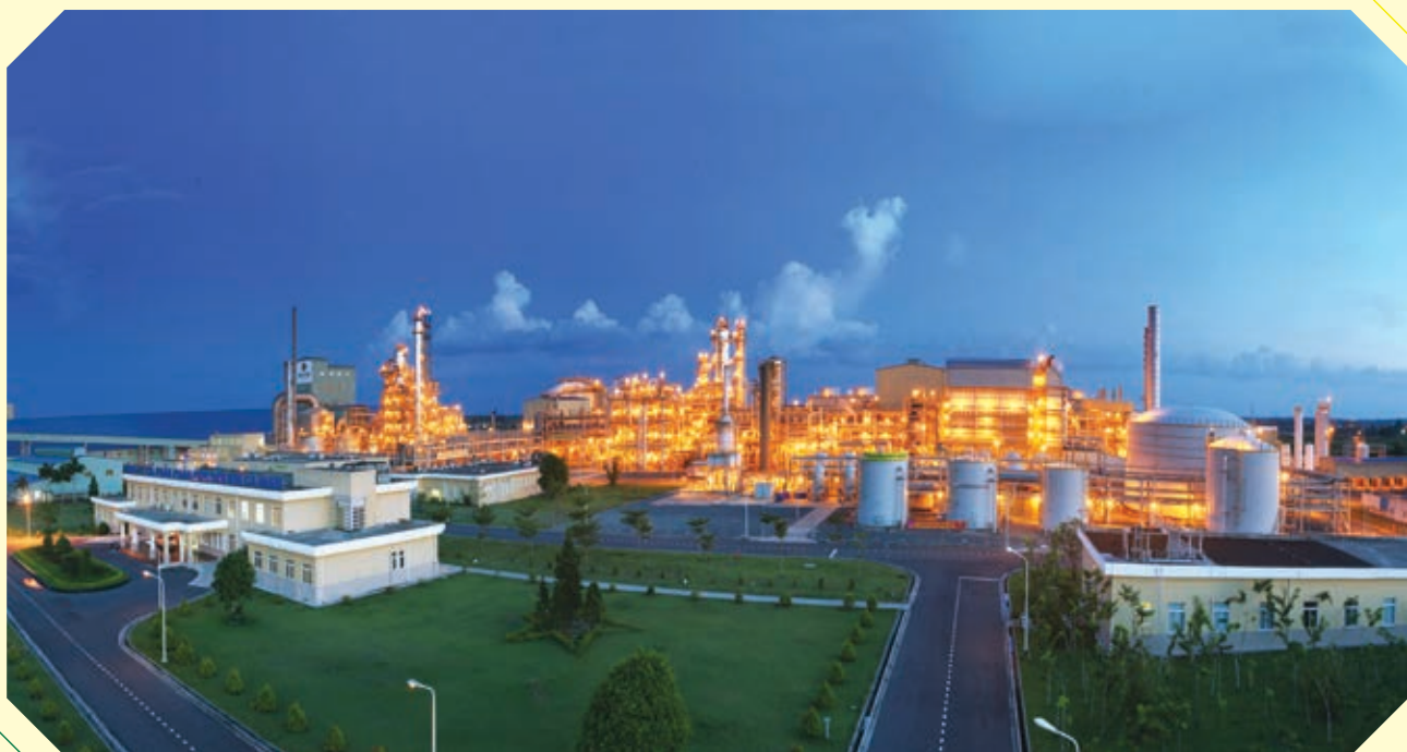
Tổng thể Nhà máy Đạm Cà Mau trong cụm Khí - Điện - Đạm Cà Mau

Trước bức tranh đầy cơ hội và thách thức đó, năm 2021 PVCFC đã ghi nhận những kết quả rất đáng tự hào khi đạt được những thành tựu cả về sản xuất lẫn kinh doanh: Tổng doanh thu đạt 10.041,67 tỷ đồng, vượt 10% so với kế hoạch; Lợi nhuận trước thuế đạt 1.956,27 tỷ đồng, vượt 12% kế hoạch; Lợi nhuận sau thuế đạt 1.826,12 tỷ đồng, vượt 11% so với kế hoạch. Sản lượng sản xuất đạt 898,56 nghìn tấn Urê quy đổi, vượt 3% so với kế hoạch; phân bón tự doanh đạt 161,07 nghìn tấn, vượt 7% kế hoạch.